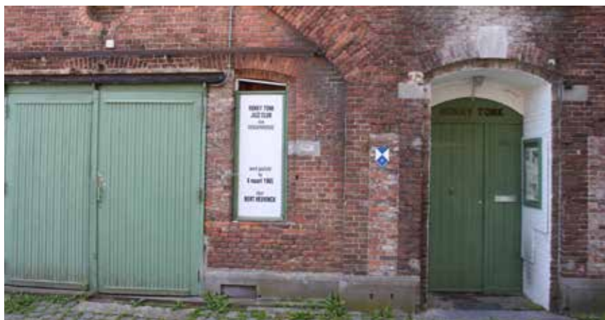
foto: Jazzclub Honkey Tonk huist in een van de bunkers van de oude vesting van Dendermonde.

Zondag 13 september in Dendermonde, Buggenhout, Laarne, Lebbeke en Wetteren.