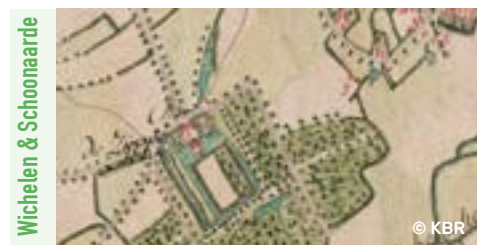
Wichelen & Schoonaarde